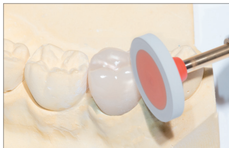
9787: Hochglanzpolitur der Außenfläche. Empfohlene Drehzahl: 7.000 – 12.000 min -1 High gloss polishing of the external shapes, Recommended rotary Speed: 7.000 – 12.000 rpm