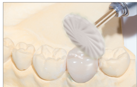
9769F: Hochglanzpolitur der Krone ohne hohe Anpresskraft. Empfohlene Drehzahl: 7.000 – 12.000 min -1 High gloss polishing of the crown without high pressure, Recommended rotary Speed: 7.000 – 12.000 rpm