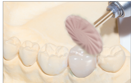
9769M: Glätten der Krone. Empfohlene Drehzahl: 7.000 – 12.000 min -1 Smoothing of the crown, Recommended rotary Speed: 7.000 – 12.000 rpm