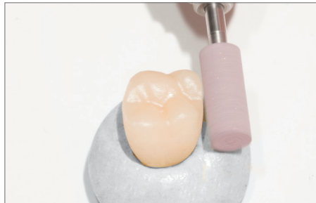
9735G: Beschleifen des Kontaktpunktes. Empfohlene Drehzahl: 8.000 – 12.000 min -1 Trimming the contact points, Recommended rotary Speed: 8.000 – 12.000 rpm