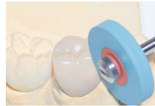
DCA06: Glätten der Außenform. Empfohlene Drehzahl: 7.000 – 12.000 min -1 Smoothing of the external shape, Recommended rotary Speed: 7.000 – 12.000 rpm