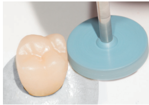
9736H: Beschleifen des Kontaktpunktes. Empfohlene Drehzahl: 8.000 – 12.000 min -1 Trimming the contact points, Recommended rotary Speed: 8.000 – 12.000 rpm