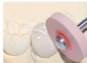
DCA12: Hochglanzpolitur der Außenform. Drehzahl: 7.000 – 12.000 min -1 High gloss polishing of the external shapes, Recommended rotary Speed: 7.000 – 12.000 rpm