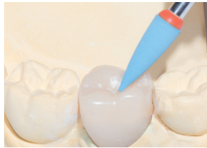
DCA04: Gezieltes Glätten der Okklusalfäche. Empfohlene Drehzahl: 7.000 – 12.000 min -1 Smoothing of the occlusal surface, Recommended rotary Speed: 7.000 – 12.000 rpm