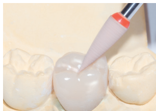
DCA10: Hochglanzpolitur der Okklusalfäche ohne hohe Anpresskraft. Empfohlene Drehzahl: 7.000 – 12.000 min -1 High gloss polishing of the occlusal surfaces without high pressure, Recommended rotary Speed: 7.000 – 12.000 rpm