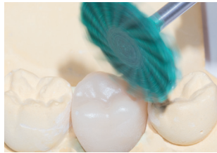
9771G: Vorpolitur der Krone ohne hohe Anpresskraft. Empfohlene Drehzahl: 7.000 – 12.000 min -1 Pre-polishing of the entire crown, Recommended rotary Speed: 7.000 – 12.000 rpm