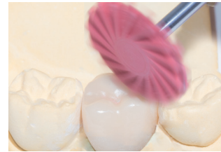
9771F: Hochglanzpolitur der Krone ohne hohe Anpresskraft. Empfohlene Drehzahl: 7.000 – 12.000 min -1 High shine polishing of the entire crown, Recommended rotary Speed: 7.000 – 12.000 rpm