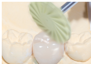
9771C: Spiegelglanzpolitur der Krone ohne hohe Anpresskraft. Empfohlene Drehzahl: 7.000 – 12.000 min -1 Mirror finish polishing of the entire crown, Recommended rotary Speed: 7.000 – 12.000 rpm