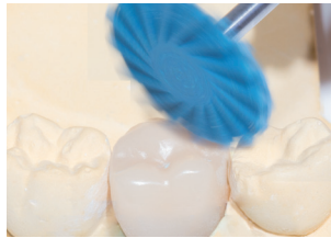
9771M: Politur der Krone ohne hohe Anpresskraft. Empfohlene Drehzahl: 7.000 – 12.000 min -1 Polishing of the entire crown, Recommended rotary Speed: 7.000 – 12.000 rpm