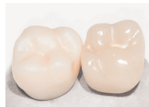
Vorher - Nachher: Hochglanzergebnisse mit den MEISINGER Luster® Kits Before and After: High gloss results with MEISINGER Luster® Kits

Die Twist Polisher passen sich mit ihren flexiblen Lamellen jeder Oberflächenstruktur an. Mit der Vorpolierstufe werden zunächst Rauheiten reduziert, so dass anschließend die Hochglanzpolitur erfolgen kann. Sie erhalten in vier Schritten glänzende Ergebnisse auf Ihren Keramikrestaurationen und das innerhalb kürzester Zeit. Wir empfehlen, die Twist Polisher bei einer Drehzahl von 7.000 bis 12.000 min -1 anzuwenden.