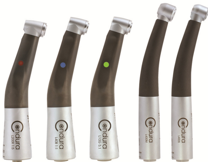
Bildunterschrift PM1513_01: MEISINGER, Neuss: Neues Antriebs-Sortiment: „MEISINGER:Condura“ Winkelstücke und Turbinen